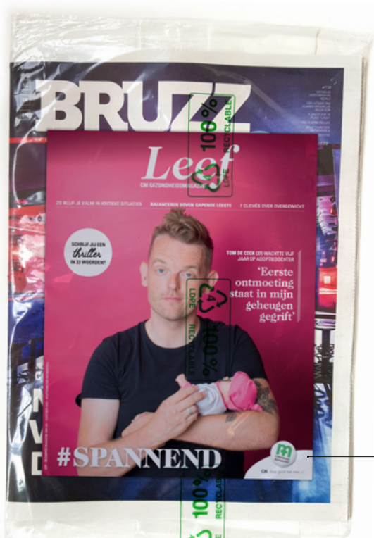
Encartage brochure of folder

Nederlandstalige én anderstalige Brusselaars, mensen die in Brussel wonen of werken, die in Brussel winkelen of die naar Brussel komen om te genieten van het rijke cultuur- en uitgaansleven.